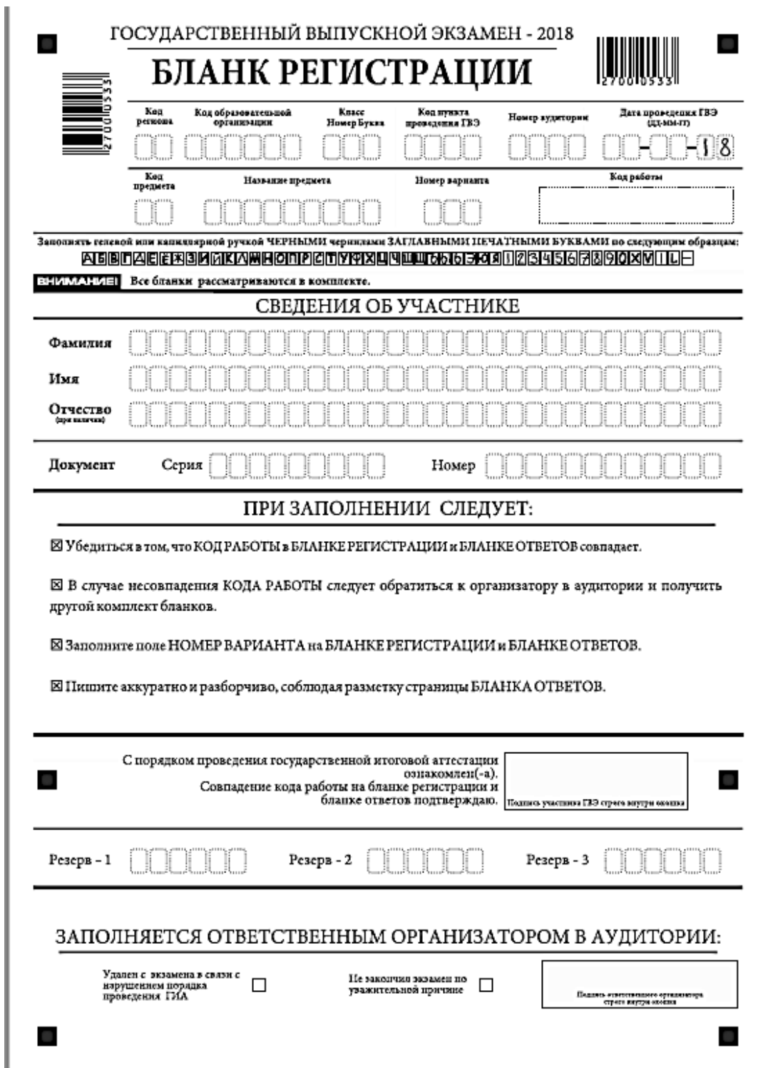
Рис. 7 Бланк регистрации ГВЭ

Заполнение полей ответственным организатором в аудитории обязательно, если участник ГВЭ удален с экзамена в связи с нарушением установленного порядка проведения ГИА или не закончил экзамен по уважительной причине. Отметка организатора в аудитории заверяется подписью ответственного организатора в аудитории в специально отведенном для этого поле бланка регистрации, и вносится соответствующая запись в форме ППЭ-05-02-ГВЭ «Протокол проведения ГВЭ в аудитории». В случае удаления участника ГВЭ